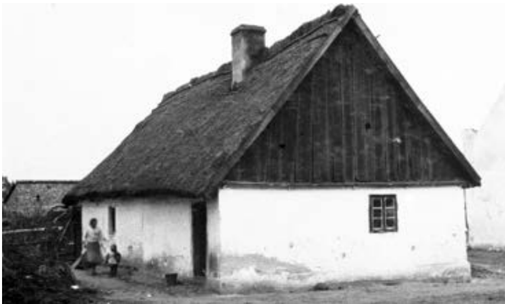
Wierzenica, dom kryty strzechą, schyłek lat trzydziestych XX w.