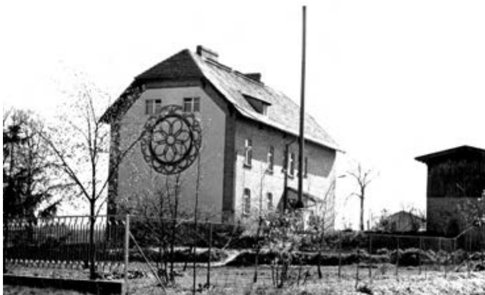
Szkoła od strony drogi do Karłowic, widoczne nieistniejące dziś: komin kotłowni, zewnętrzna ubikacja, stodoła, ok. 1978 r.