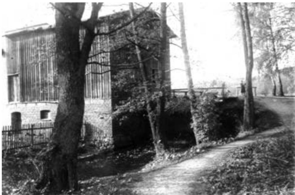
Wierzenicki młyn wodny, 1947 rok.