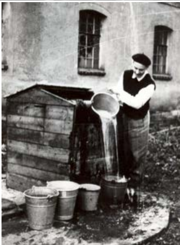
Wierzonka, nabieranie wody ze studni z korbą, lata sześćdziesiąte XX w.