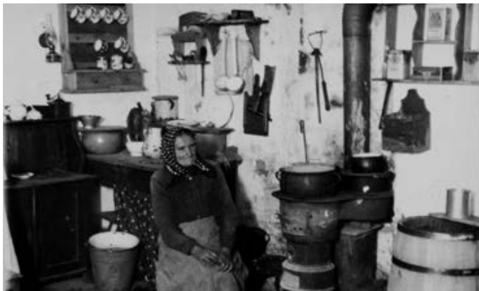
Mieszkania robotników rolnych w Wierzenicy, schyłek lat trzydziestych XX w. Na górnym zdjęciu po prawej beczka na wodę, lampa naftowa przy półce z kubkami. Na dolnym charakterystyczne obrazy serca Jezusa i Maryi.