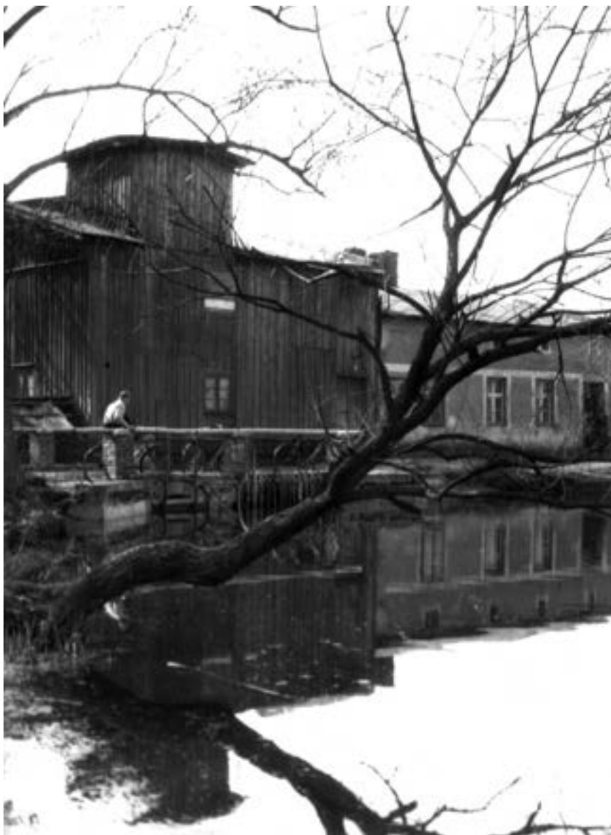
Wierzenica młyn, po prawej istniejąca do dziś młynarzówka – mieszkanie młynarza, marzec 1957 r.

<<< Młynica – budynek młyna właściwego, przed 1997 r. Koło młyńskie, przed 1975 r.