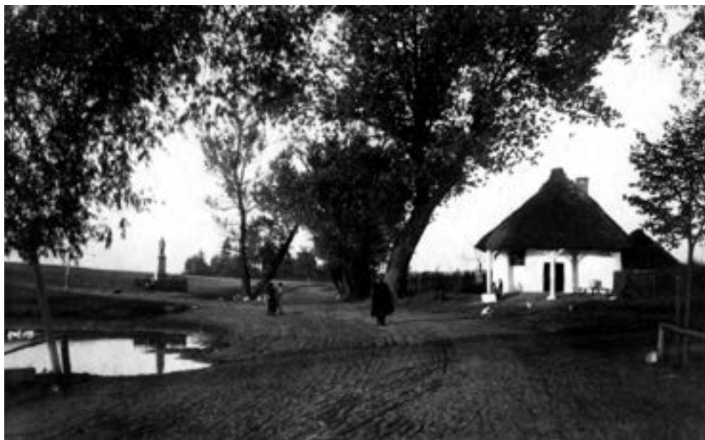
Wierzenica, dawna karczma jako ochronka, po lewej zniszczona w czasie II wojny figura św. Wawrzyńca, koniec lat trzydziestych XX w.