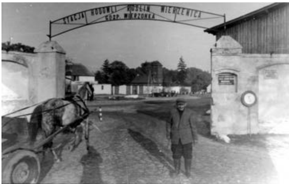
Brama wjazdowa na podwórze Stacji Hodowli Roślin Wierzenica, gosp. Wierzonka, lata siedemdziesiąte XX w.