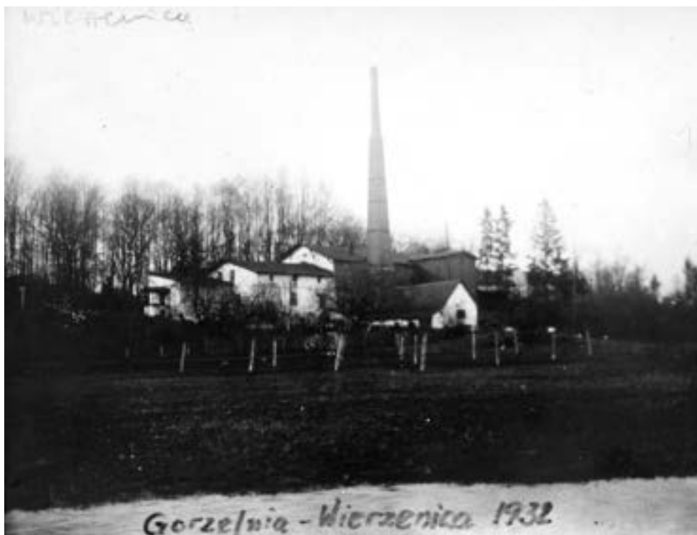
Gorzelnia w Wierzenicy w 1932 roku.