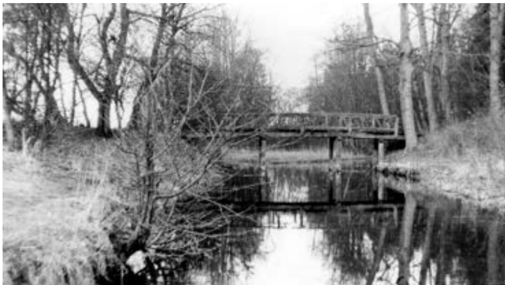
Wierzonka, nieistniejący już most, zwany przez von Treskowów „białym”, łączący park przy dworze z jego częścią leśną, lata 60 XX w.