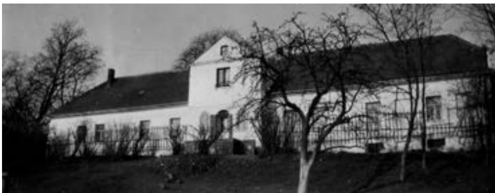
Wierzenica, dwór od strony doliny rzeki Głównej, lata trzydzieste XX w.