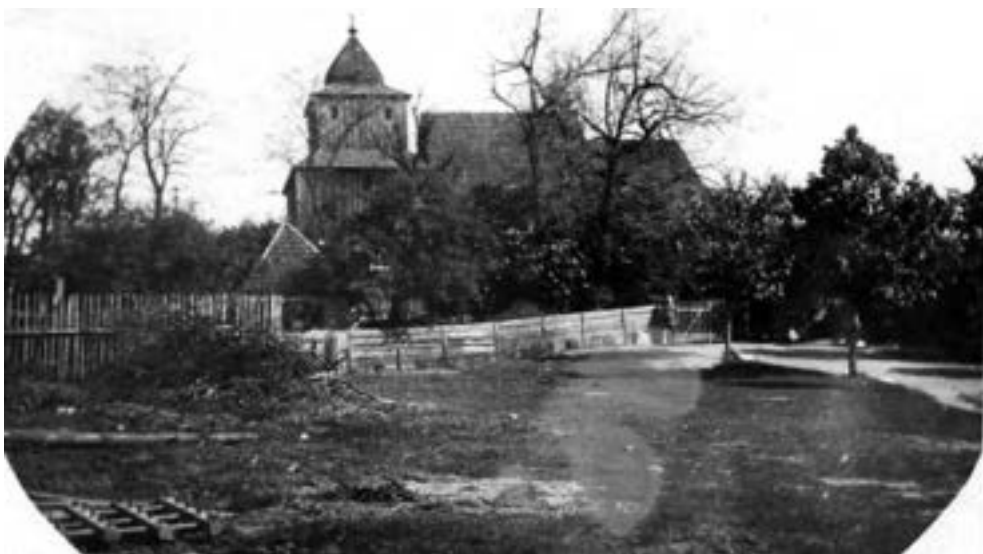
Kościół od strony południowej, około 1920 r. Na pierwszym planie po lewej widoczna drewniana brona, dalej dwa rodzaje kościelnego płotu, dach i hełm wieży kryte gontem.