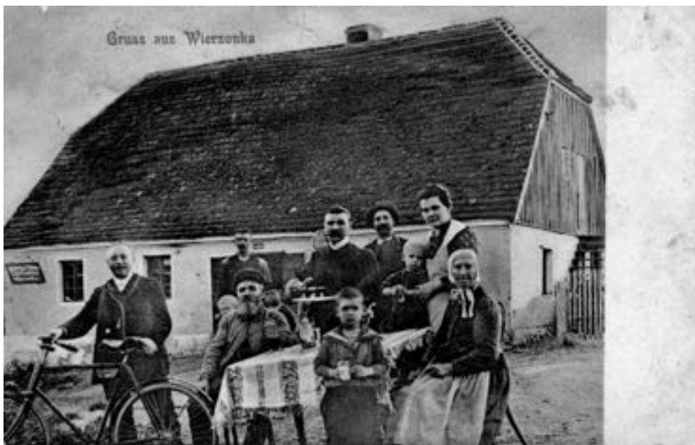
Wierzonka, gospoda na pocztówce z około 1905 r., dziś to pierwszy dom po lewej jadąc od Kobylnicy.