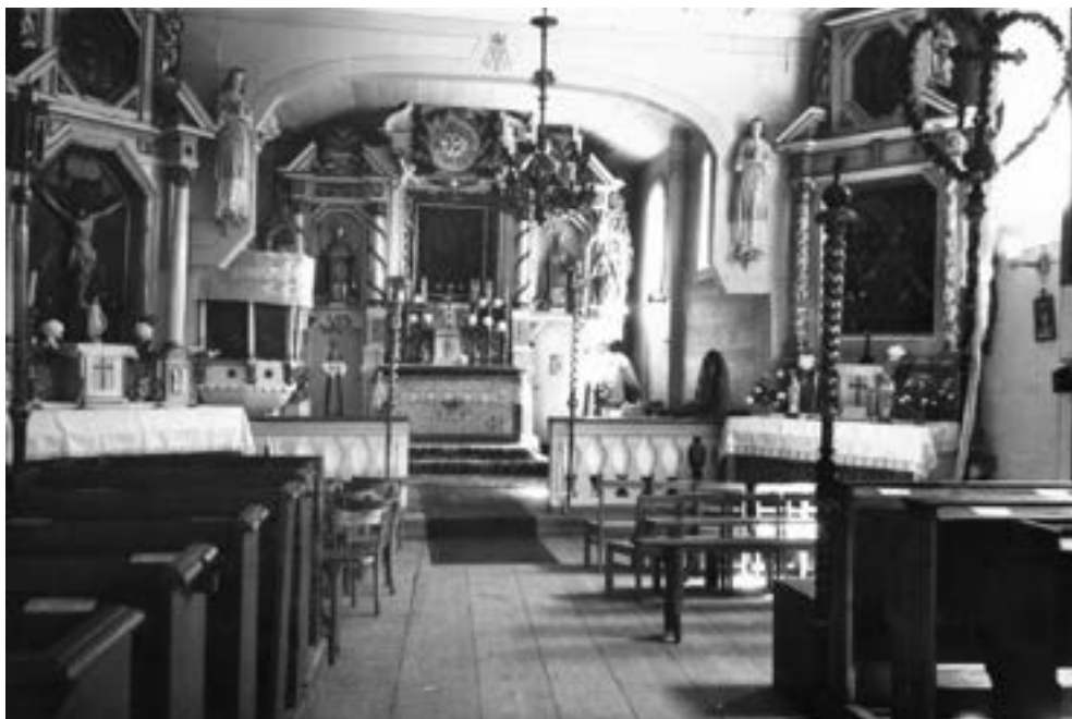
Wierzenicki kościół w 1957 r., widoczne pobielone ściany, drewniane figury aniołów po bokach łuku tęczowego.