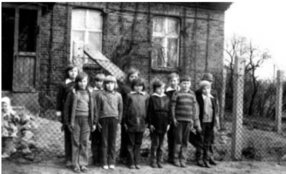
Wierzenica, jesień 1973 r. lub wiosna 1974 r., uczniowie koło szkoły (obecnie plebania), na dolnym zdjęciu w tle kościół bez kruchty zachodniej.