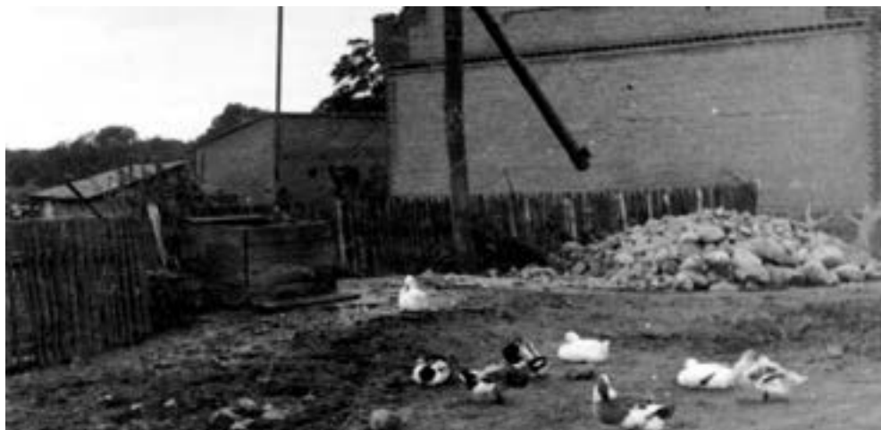
Wierzenica, studnia z żurawiem, schyłek trzydziestych XX w.