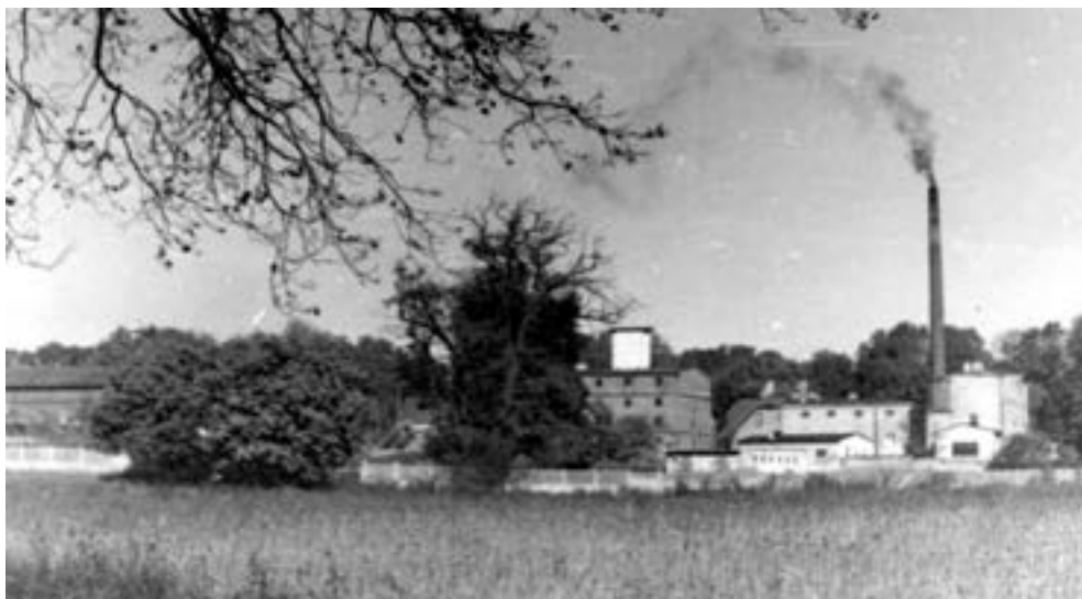
Wierzonka, widok gospodarstwa, z prawej gorzelnia, obok spichlerz, lata 80 (?)