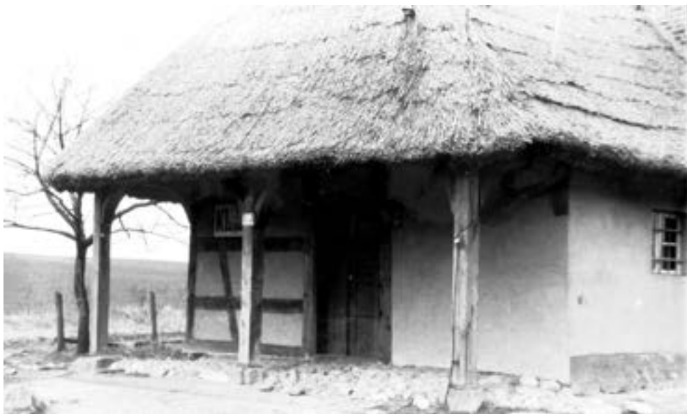
Wierzenica, dawna karczma jako klub rolnika, lata siedemdziesiąte XX w.