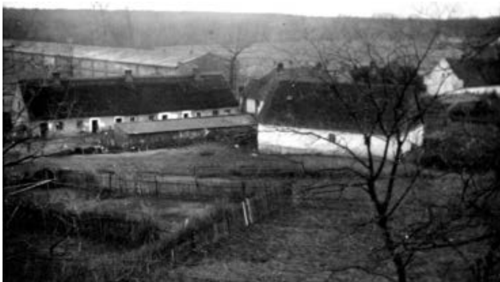
Widok na Wierzenicę z wieży kościelnej, widoczny kościelny płot, po prawej kuźnia, a dalej domy mieszkalne i nieistniejące dziś zabudowania gospodarstwa Cieszkowskich, schyłek lat trzydziestych XX w.