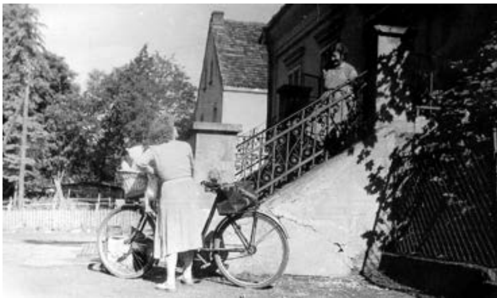
Wejście do dworu w Wierzonce, lata sześćdziesiąte XX w.