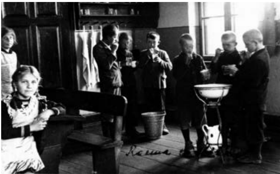
Kącik higieniczny w wierzenickiej szkole, 1938 r.