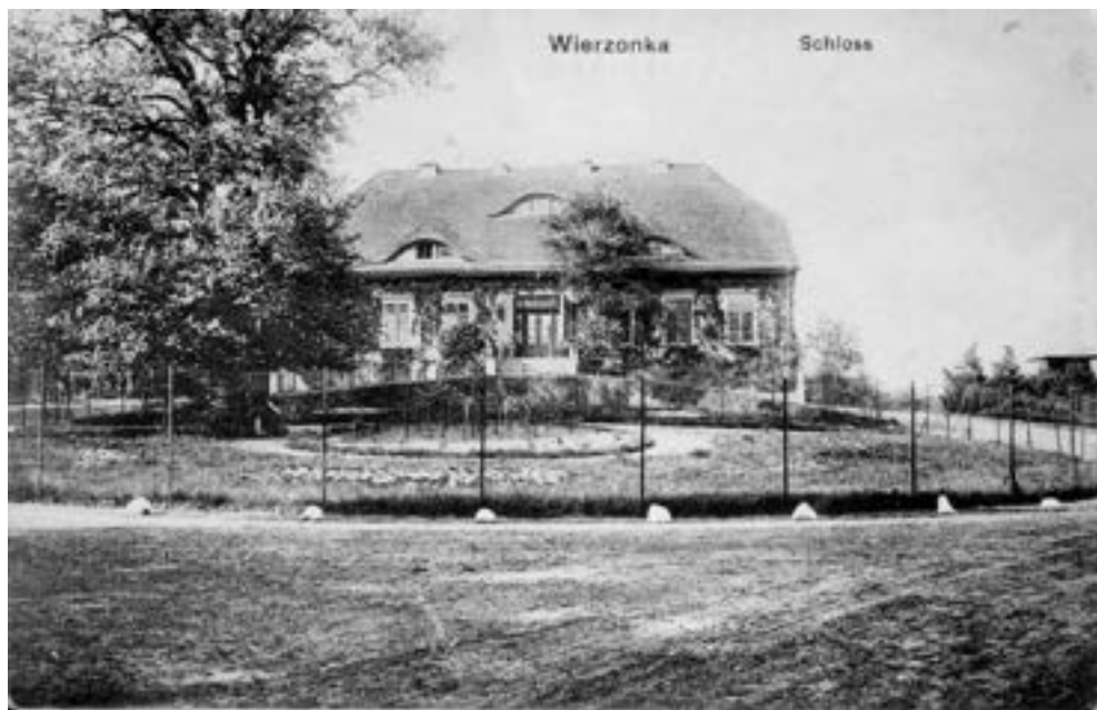
Wierzonka, dwór od frontu.