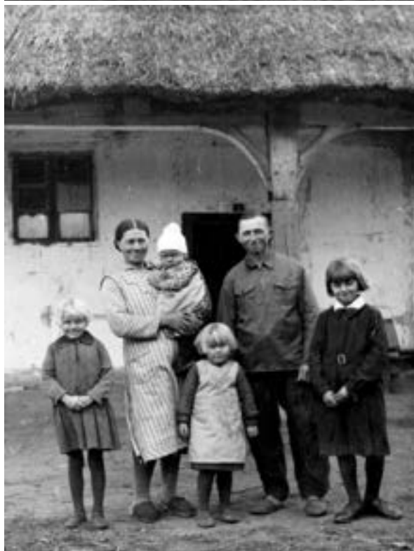
Rodzina mieszkająca w dawnej karczmie zwanej „Betlejemka” przed przekształceniem jej w ochronkę, lata trzydzieste XX w.