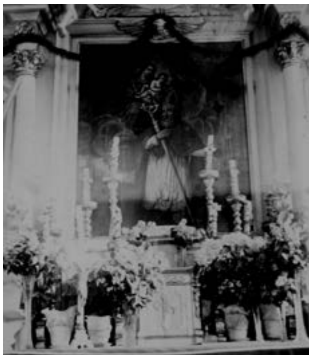
Obraz św. Mikołaja jako zasłona obrazu MB Wierzenickiej w głównym ołtarzu, schyłek lat trzydziestych XX w.