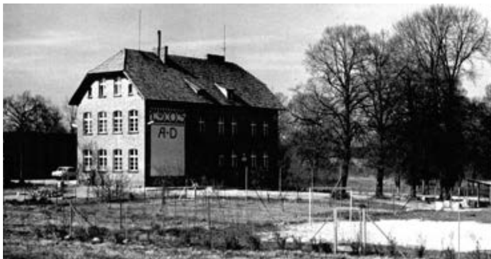
Szkoła w Wierzonce, widok od strony boiska, ok. 1978 r.