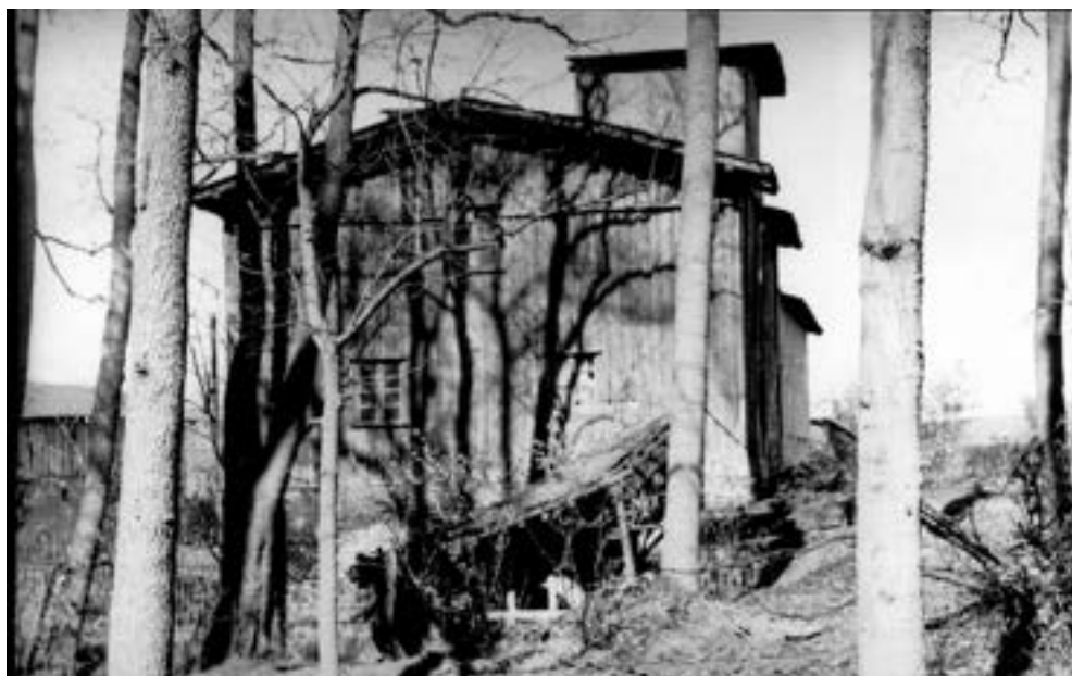
Młyn w latach siedemdziesiątych XX w., widoczne koło młyńskie.