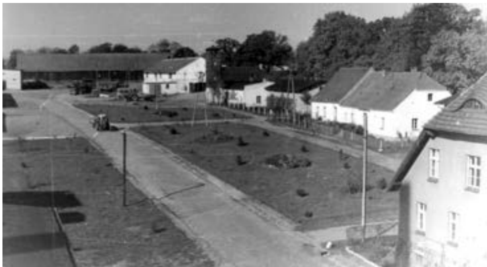
Podwórze SHR w Wierzonce, po uporządkowaniu, widać początki zazielenienia, schyłek lat siedemdziesiątych XX w.