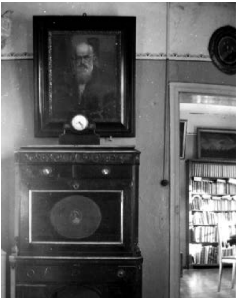
Wnętrze wierzenickiego dworu, widoczny pośmiertny portret Augusta Cieszkowskiego autorstwa K. Pochwalskiego, książki z biblioteki Cieszkowskich, lata trzydzieste XX w.