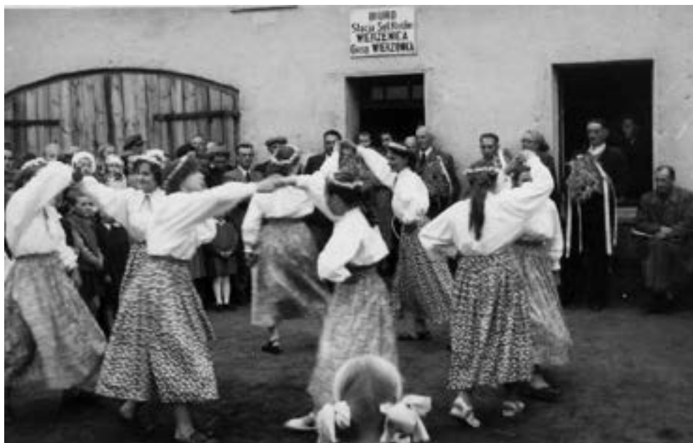
Dożynki, Wierzonka wrzesień 1956 r.