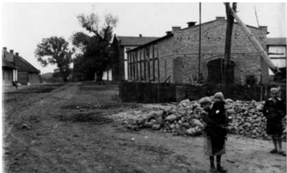
Wierzenica, za studnią z żurawiem nieistniejące dziś zabudowania gospodarstwa Cieszkowskich, po lewej domy mieszkalne w tym czworak w dworcowym stylu, schyłek lat trzydziestych XX w.