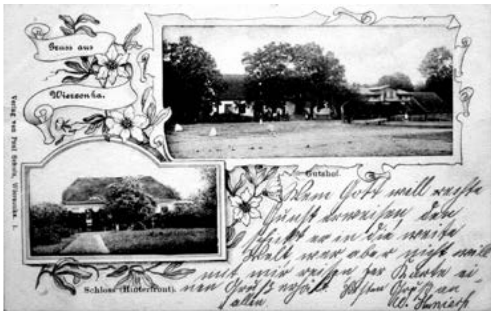
Widokówki z Wierzonki, początek XX wieku.