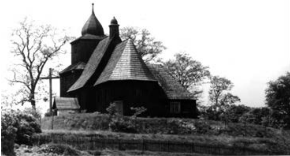
Wierzenica, kościół od strony wschodniej, ok. 1960 r., widoczne skarpy po renowacji, białe ściany kruchty południowej, hełmy wieży i sygnaturki kryte blachą.