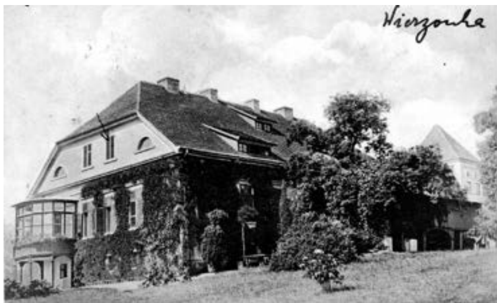
Dwór od strony parku, widoczna nieistniejąca dziś oszklona altana, obie widokówki z lat trzydziestych XX w.