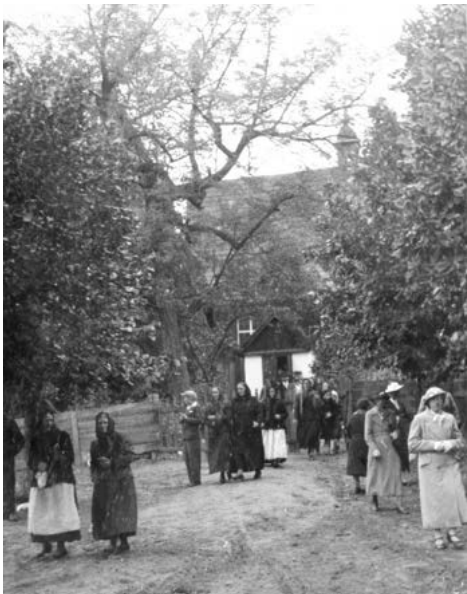
Wierni wychodzący z kościoła, lata trzydzieste XX wieku.