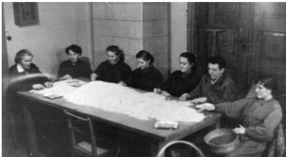
Wierzonka, darcie pierza, przełom lat pięćdziesiątych i sześćdziesiątych XX w.