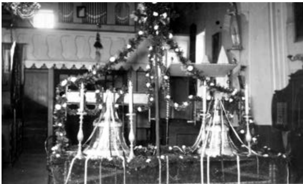
Chrzest nowych dzwonów przed powieszeniem na wieży, 1936 r.