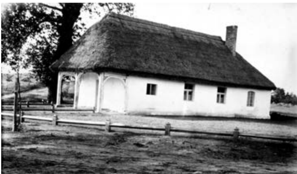
Wierzenica, dawna karczma jako ochronka (przedszkole), koniec lat trzydziestych XX w.