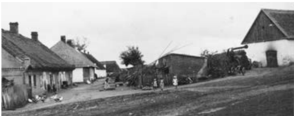
Wierzenica, po lewej domy mieszkalne, z wyjątkiem czworaka w dworowym stylu kryte strzechą, po prawej kuźnia z okopconym wejściem, a przed nią lokomobila, schyłek lat trzydziestych XX w.