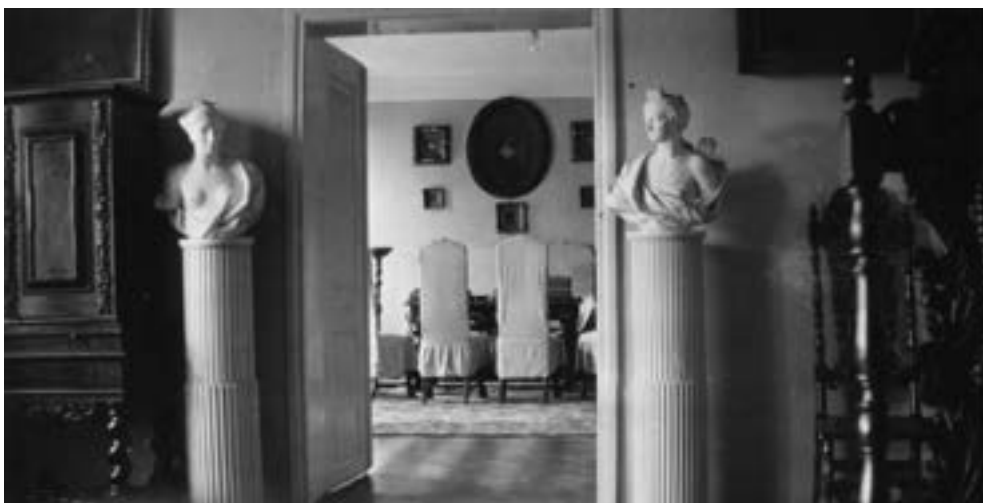
Salon wierzenickiego dworu, rzeźby Canovy (?) Wenus (z lewej) i Diany, lata trzydzieste XX w.