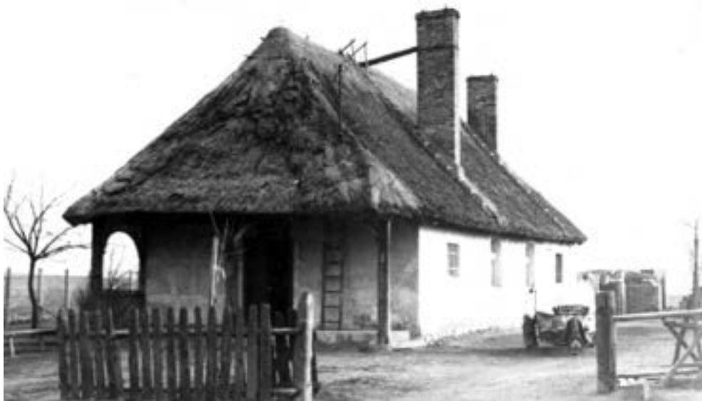
Wierzenica, dawna karczma jako dom mieszkalny, lata sześćdziesiąte XX w., widoczny dobudowany drugi komin.