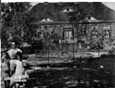
* Grass aus Wierzonka

po lewej u góry gorzelnia i spichlerz, u dołu domy pracowników w podwórzu gospodarstwa, 1907 r.,